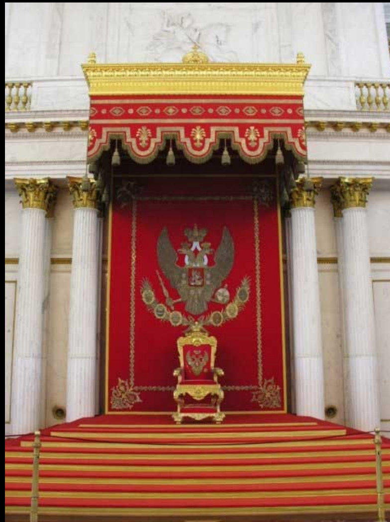
Trono no Hall São Jorge - Palácio de Inverno