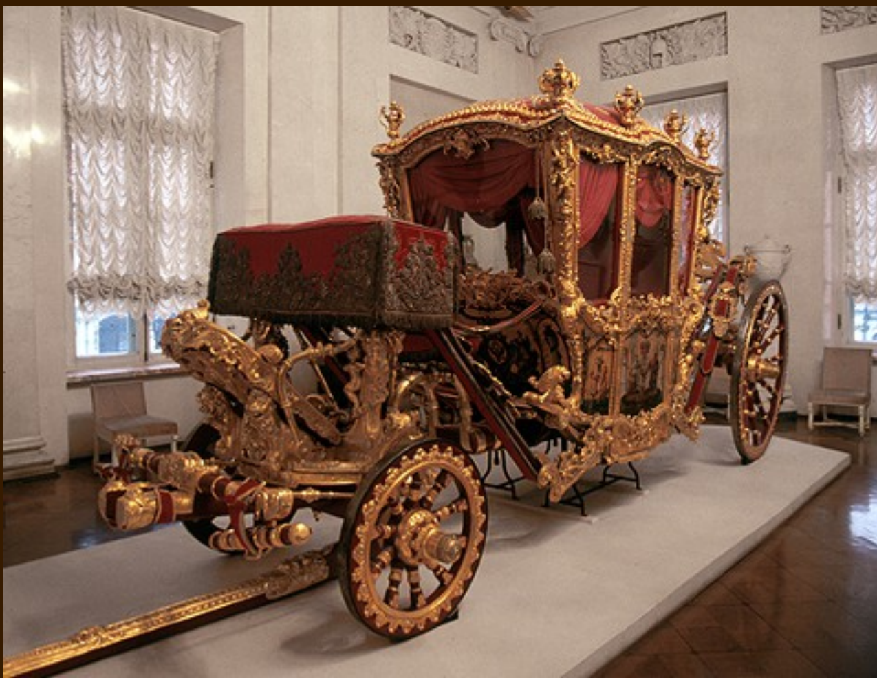
Hall Marechal-de-Campo - Grande carruagem francesa, 1720s - Gobelins Factory - Paris