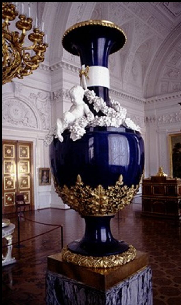
O Hall Branco – Vaso – Fim do século 18 - Sèvres