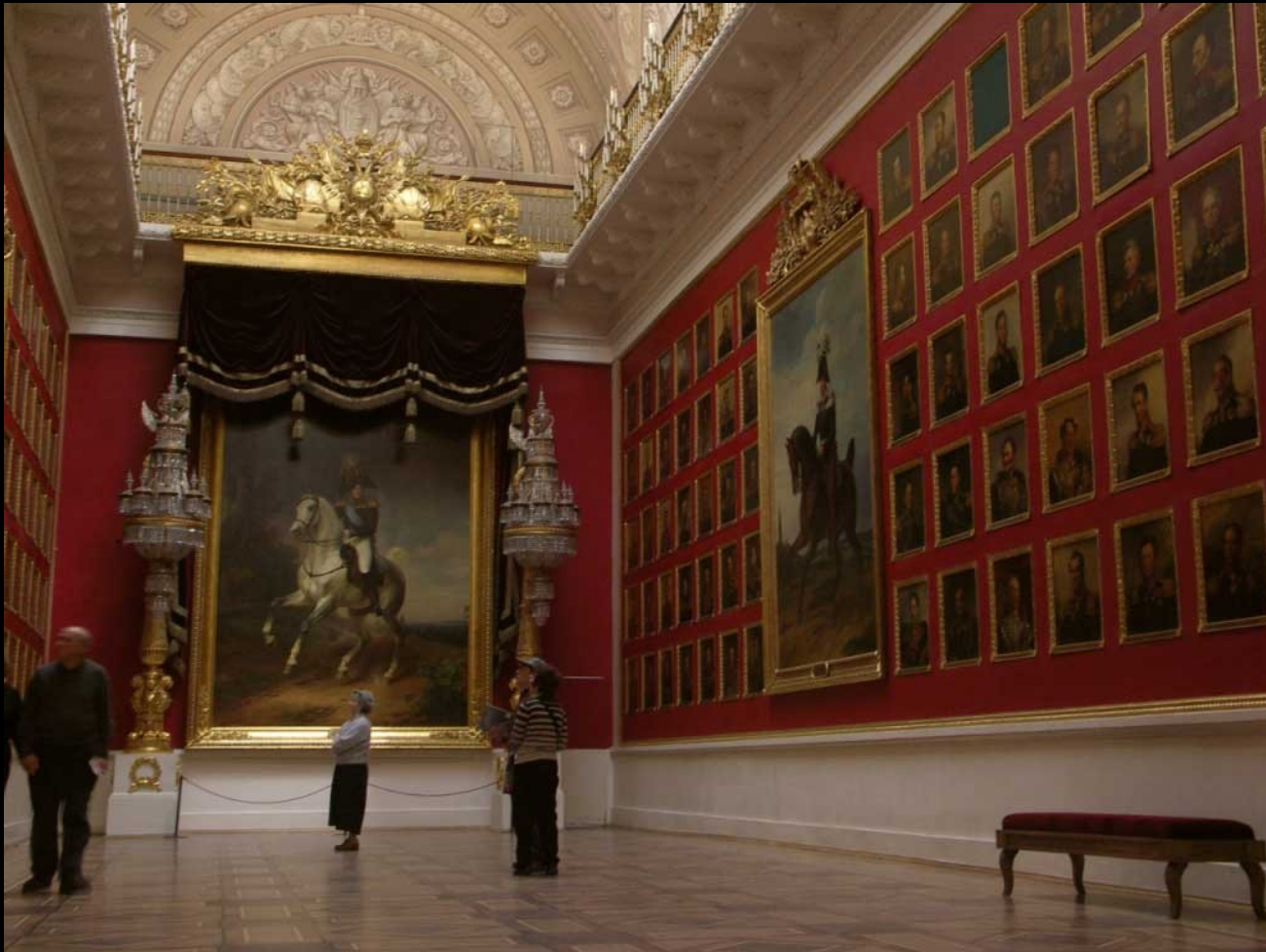
Museu Hermitage - Interior