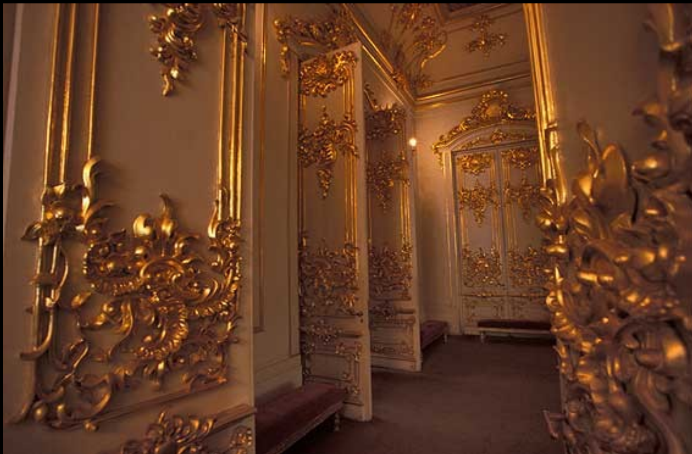
Museu Hermitage - Interior