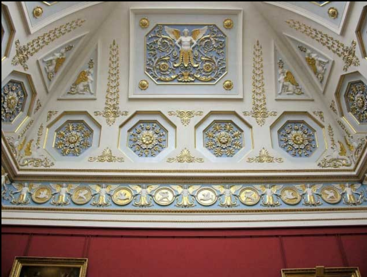
Detalhe do teto do Grande Salão Italiano