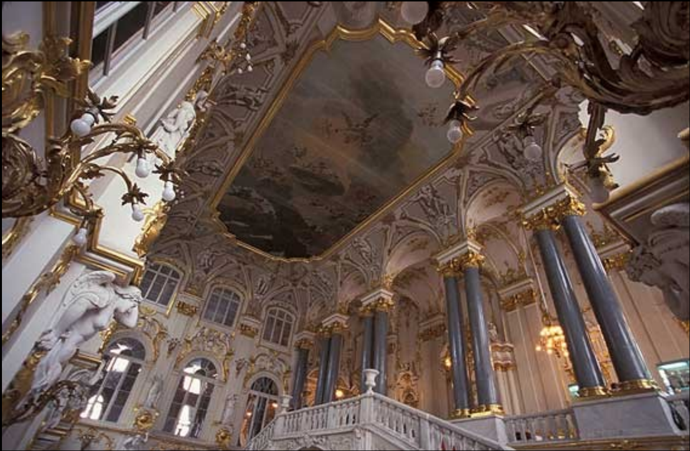
Teto sobre a escadaria Jordaniana no Palácio de Inverno