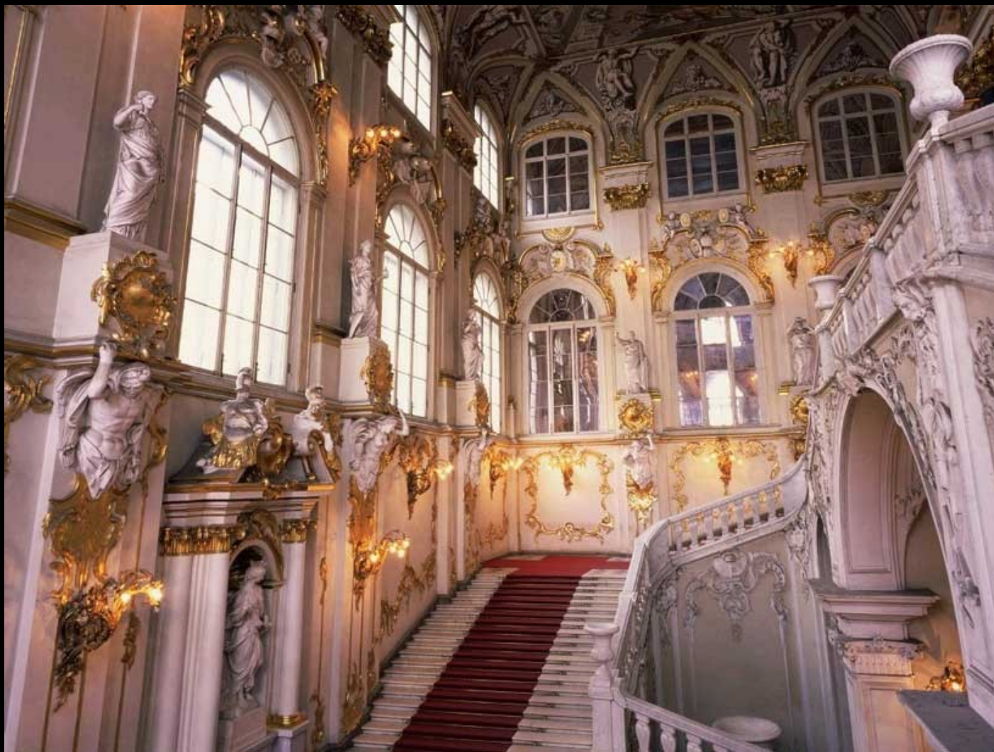
A escadaria principal do Palácio de Inverno – fragmento do interior