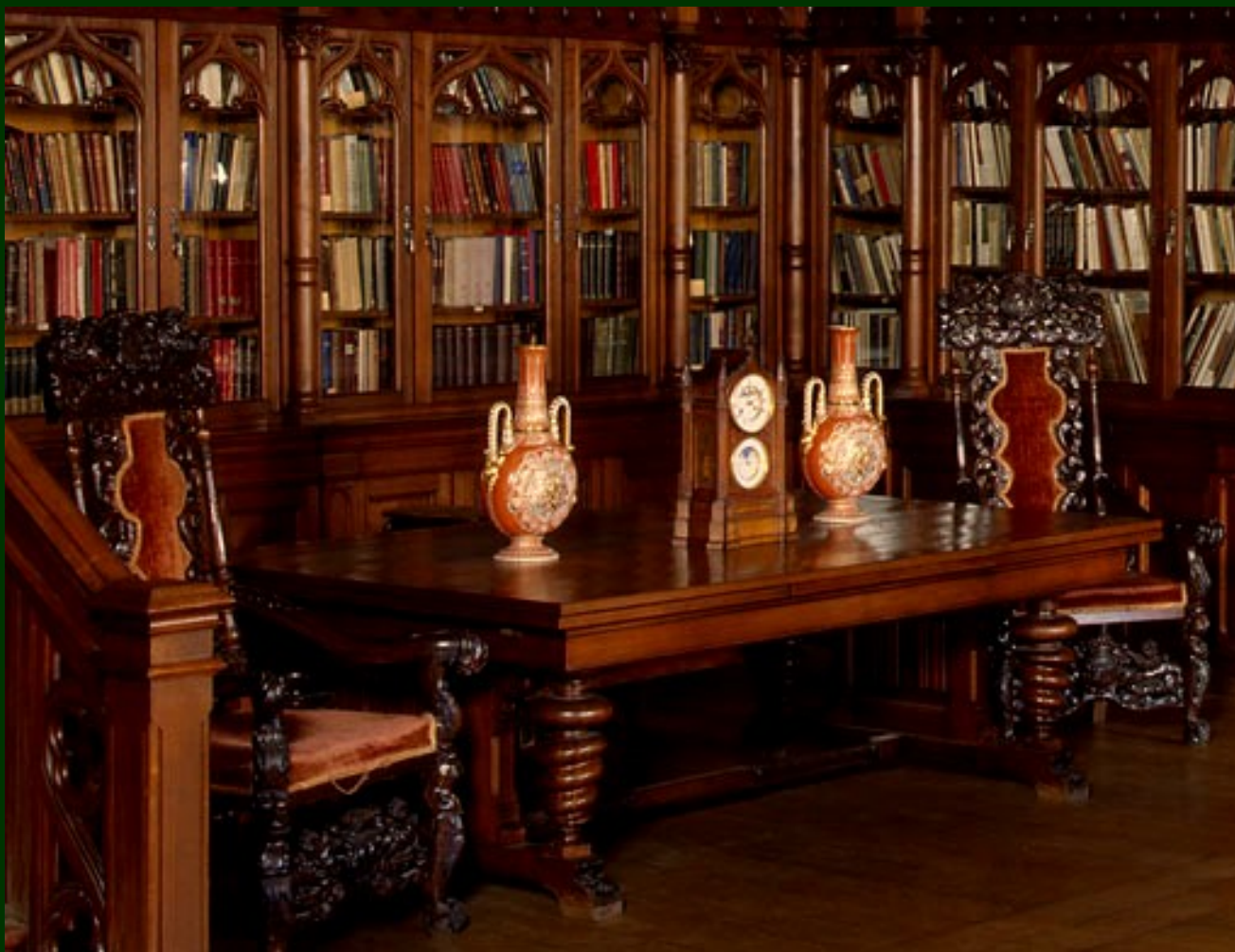
A Biblioteca de Nicholas II – Detalhe do interior