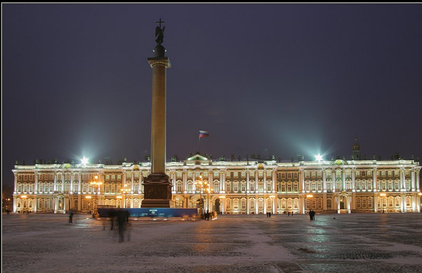
Museu Hermitage à noite, São Petersburgo, Rússia