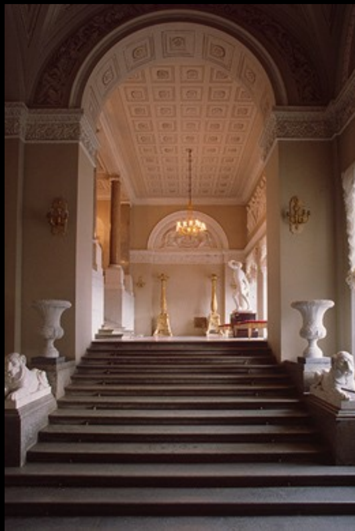
A escadaria October, vista do seu patamar