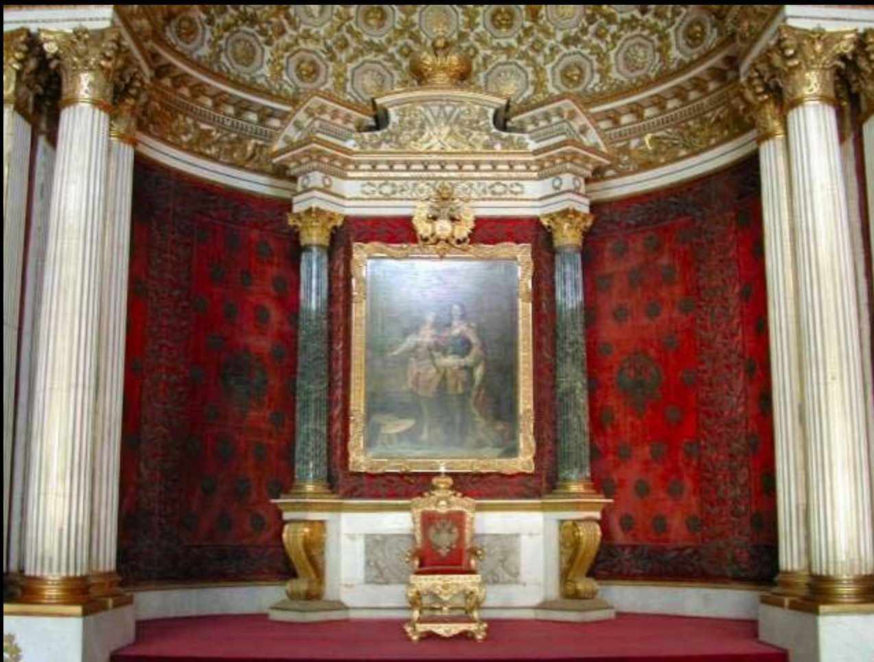
Salão do Pequeno Trono - Palácio de Inverno