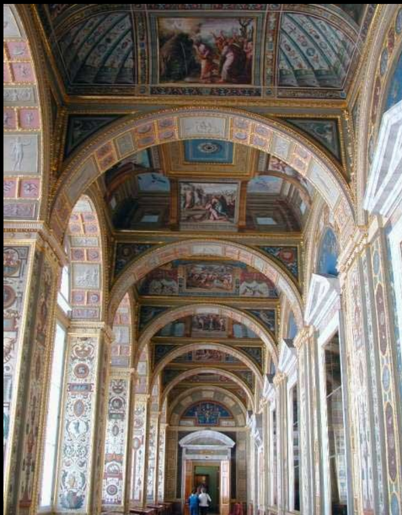
A Galeria de Raphael, no Grande Hermitage, apresenta fiéis reproduções de afrescos do Vaticano