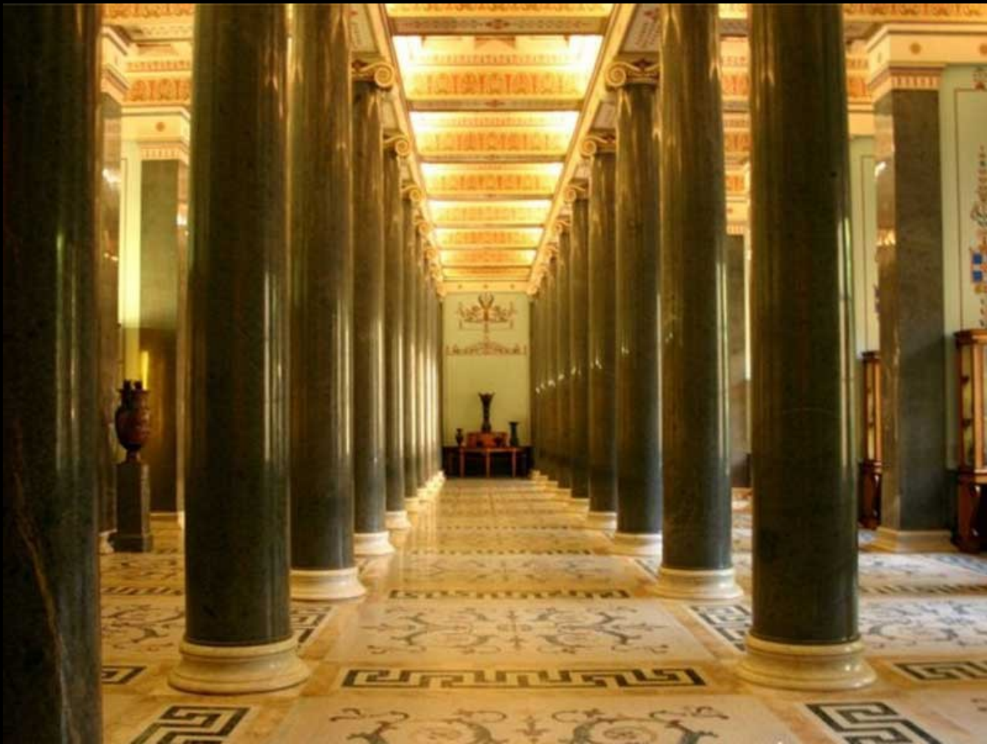
Museu Hermitage - Hall