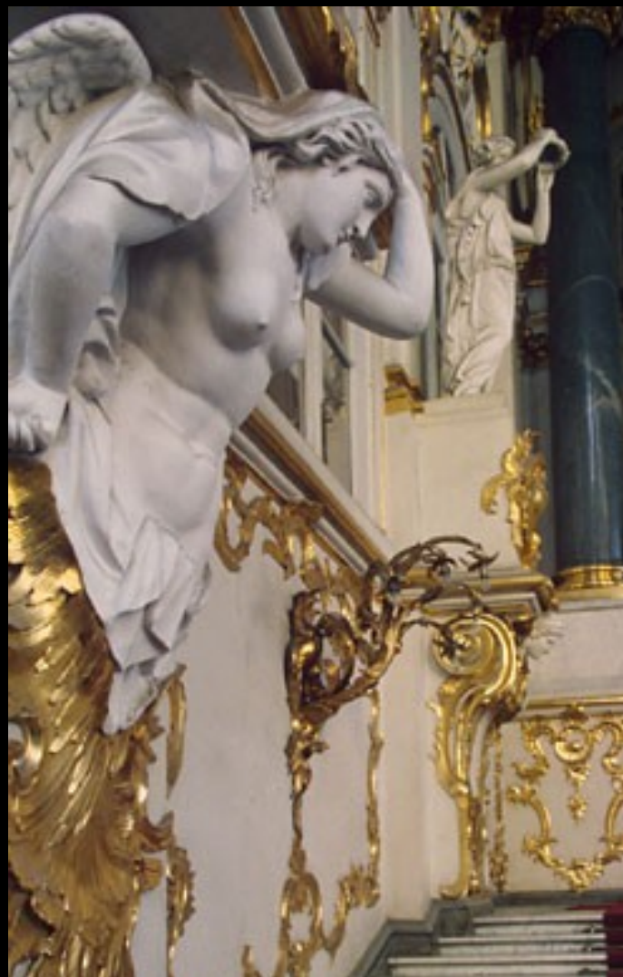
A escadaria principal do Palácio do Inverno -Detalhe