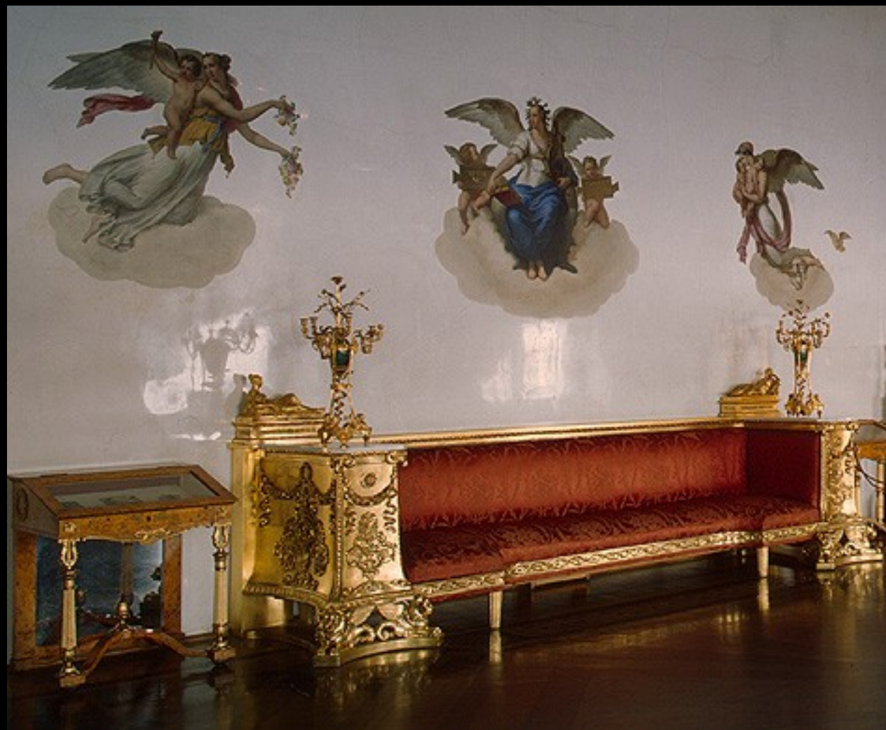
O Salão Malaquita – Detalhe do interior